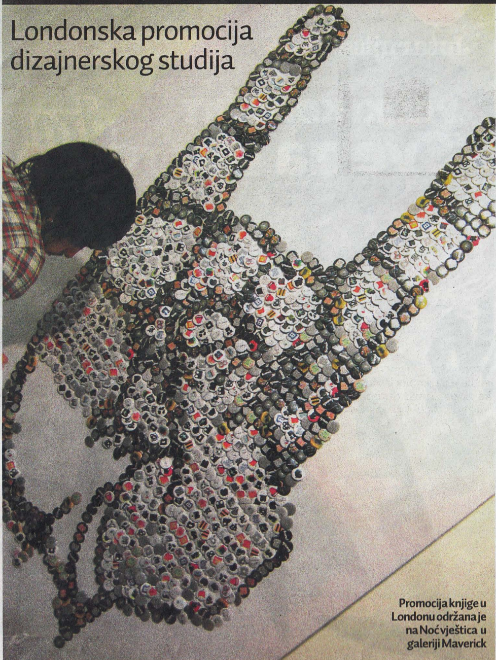
Promocija knjige u Londonu održana je na Noć vještica u galeriji Maverick